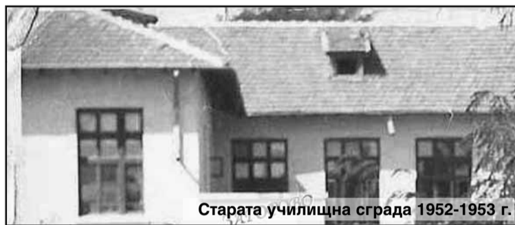
Старата училищна сграда 1952-1953 г.

След Освобождението на България, село Сараново и гарата остават в територията на Източна Румелия /подвластна на султана/, в Т. Пазарджишкия департамент, в чийто състав са включени няколко околии - Т. Пазарджишка, Ихтиманска, Пещерска, Панагурска и Копривщенска. По инициатива на Гаврил Кръстевич, през 1880г. се извършва преброяване на населението - „Официална статистика на Източно-Румелийското население“. Село Сараново се състои от 112 къщи, 207 домакинства, 970 жители- българи и 132 турци. Десет години по-късно, през 1890 г., селото вече има 130 къщи. Намира се почти на полето. Основният поминък на населението е земеделие. В Сараново има две оброчища, които селяните почитали на празниците - „Св. Георги“ и „Св. Троица“. По това време вече е била построена и църквата „Св. Вкм. Харалампий“. Гарата също се развива интензивно. През 1910 г., според „Резултати от преброяване на населението на Царство България“, община Сараново, която включва с. Злокучене, с. Сараново и гара Саранбей, има вече 1900 жители, като 1343 са жителите на селото, а 253 - на гарата. Мочурливите места около гарата са засадени