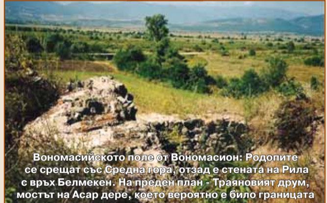
Вonomасийското поле от Vonomасион: Родопите се срещат със Средна гора, отзад е стената на Рила с връх Белмекен. На преден план - Траяновият друм, мостът на Асар дере, което вероятно е било границата

назад. Първият ден на похода мина без загуби. На другия ден, тъкмо когато минавахме през тясната клисура по един дълбок лъкатушен път под гъсти гори, българите ни нападнаха внезапно и със страшна сила. Те избиха безбройно множество наши войници. Турихара дори на палатката ска, преследвани докрай от българите, успяха да стигнат ГРАНИЦАТА и да побягнат на територията на империята.”