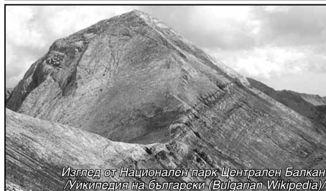
Изглед от Национален парк Централен Балкан /Уикипедия на български (Bulgarian Wikipedia)/