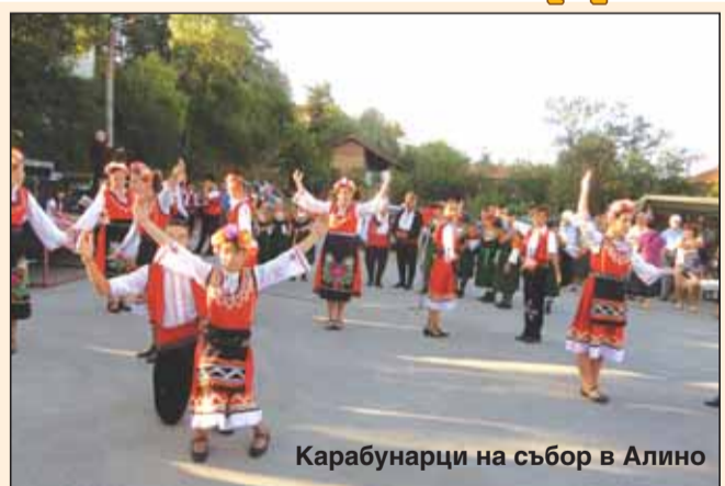
Карабунарци на събор в Алино

Легендите и историята разказват, че през 1633г. от с. Алино, Самоковско става едно голямо преселване на българи в Карабунар. Според очевидци, при разчистването на местните гробища около 1970 г. е намерен камък, на който с „църковен шрифт” пишело: „Тук почива Кара Стоян войвода, който в лето Господне 1633-то изведе селяните от Алино и ги засели тук”. През същата тази 1633 г. голям пожар изпепелява Алино. Това може би е също една от причините, довела до слизането на шопите по тези земи и трайното им заселване тук. Че селяните слезли от Самоковско,