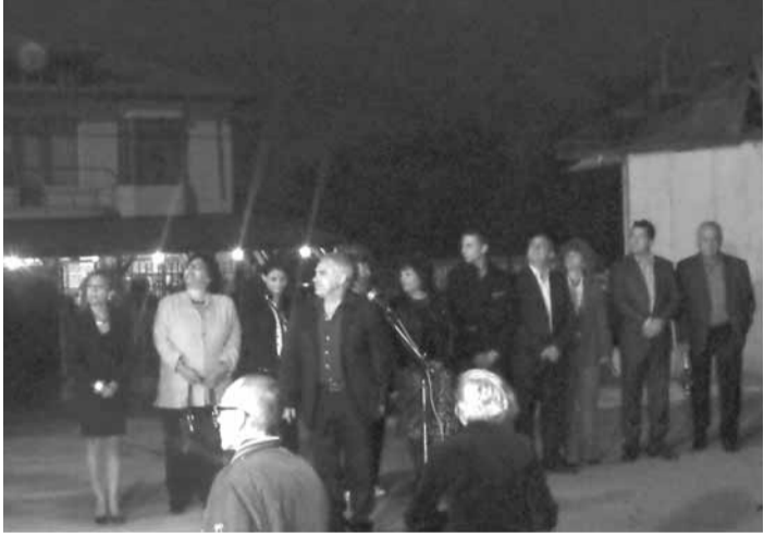
ДУМАТА Е НА КАНДИДАТ – КМЕТЪТ...