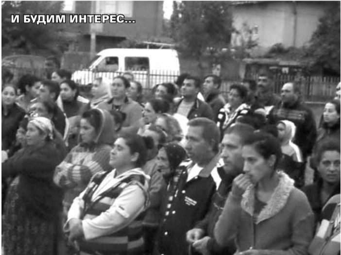
МОМЕНТИ ОТ МИТИНГИТЕ