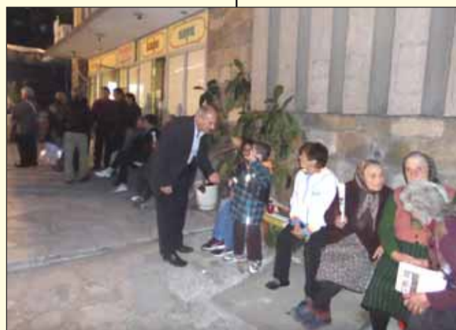
бягат в чужбина, а така ги губим като специалисти,

Г-жа Кърджийска допълни призива с това, че е време да се работи за младите, които днес, поставени в безизходица,