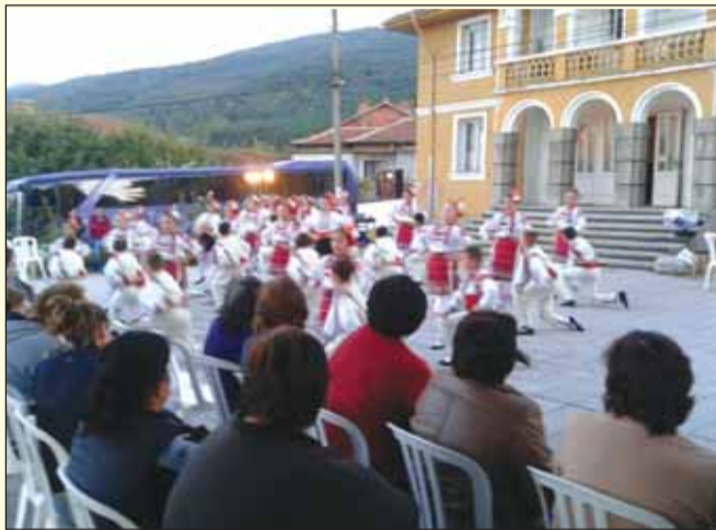
Ковачево и певиците от Бошуля. Затрогващо е да видиш на сцена хората от