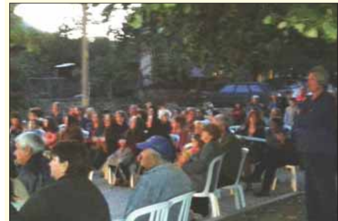
ността на Загорovo – танцьорите от Симеоновец и

участието на местната власт. Всичко е в ръцете на избирателите – да наддее разумът, а не залитането след показни „дарителски” акции. Ние, хората от Загорovo 2015 сме убедени, че варварци ще гласуват разумно и ще подкрепят професионализма! Те разбраха – доверие за доверие! Разбраха, че нашият успех ще бъде победа за всички!