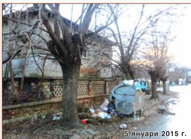
5 януари 2015 г.

Величествените екземпляри на гара Септември ще навършат столетие, за това време те се превърнаха в емблема на града ни. Вековни дървета, горди и безмълвни, скрили в себе си мъдростта на историята. И посланието, че сме длъжни да ги съхраним!