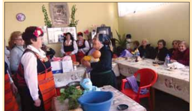
Бабинден в Пенсионерски клуб „Надежда“ - гр. Септември. Обичаят „Поливане“