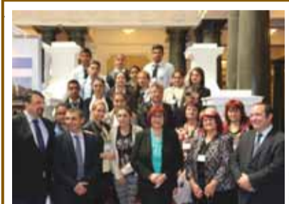
Ученици от Септември - на посещение в Парламента по покана на Бойка Маринска